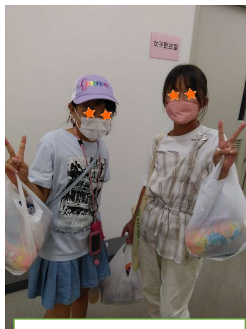
お弁当と寄付品で両手いっぱい