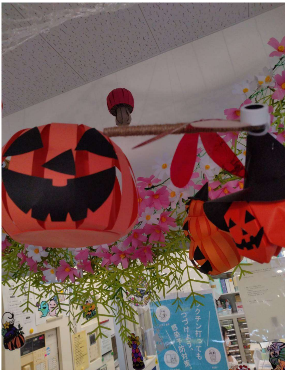
牧野生涯学習センター ハロウィン飾りつけ

ご家族そろって参加できるようにいろいろなイベントなども開催してまいります。たくさんの保護者の方にも参加いただき、子育ての意見交換や悩み事の共有の場も増やしていきたいと思っております。