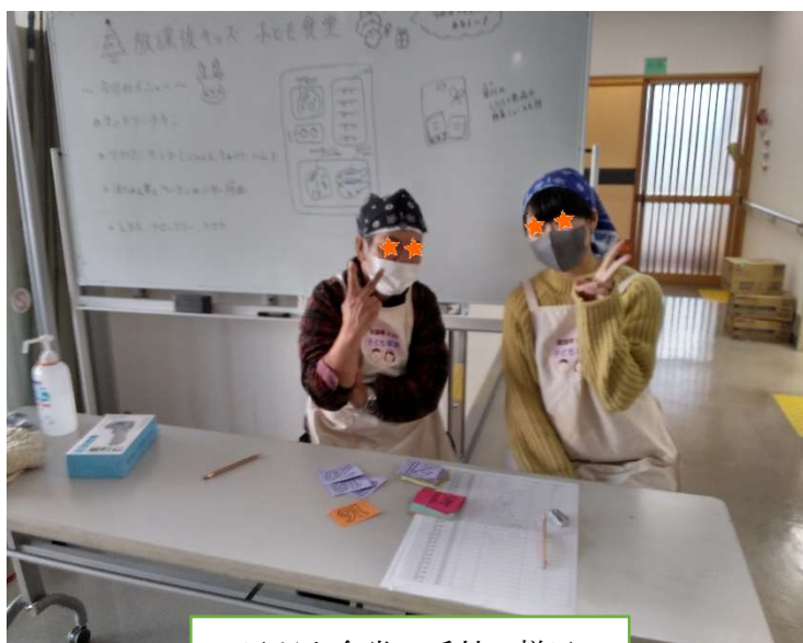
子ども食堂 受付の様子

これからもボランティアの皆様のお力を借りながら、放課後 kids の子ども食堂を盛り上げていきたいと思っております。