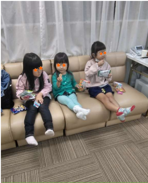
フリースペースまずはおやつタイム