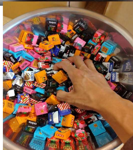
ハロウィン チロルチョコつかみ取り