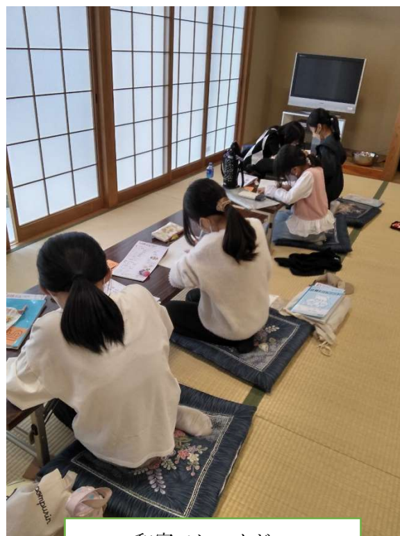
和室でしゅくだい