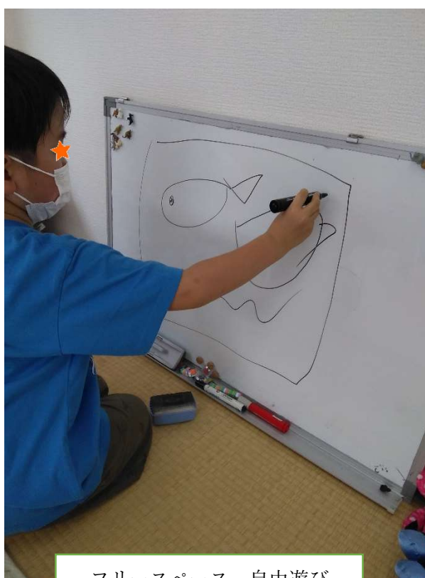
フリースペース 自由遊び