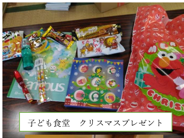
子ども食堂 クリスマスプレゼント