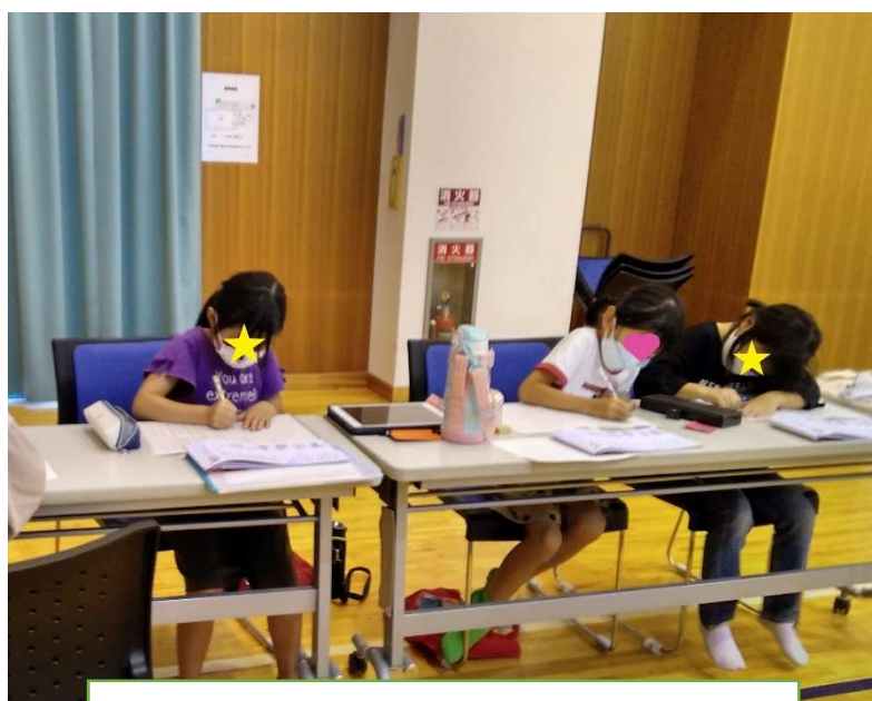
集会室で遊んでいる子たちを横目に見ながら