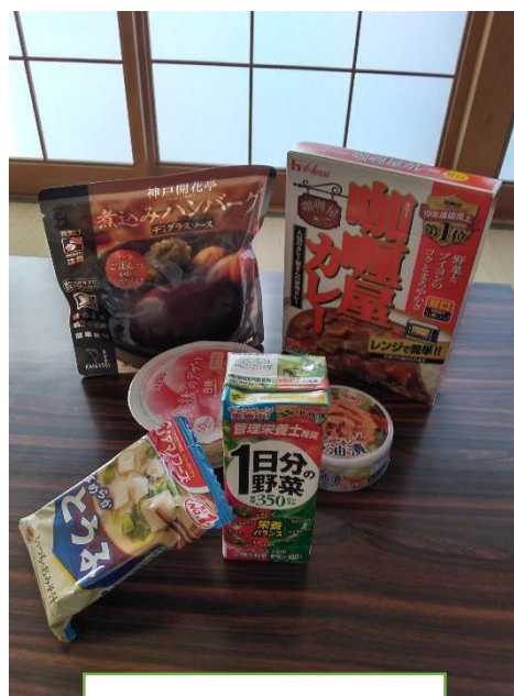
大阪府からの寄付品