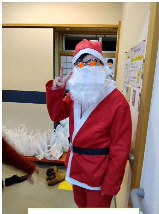
子ども食堂 クリスマス会