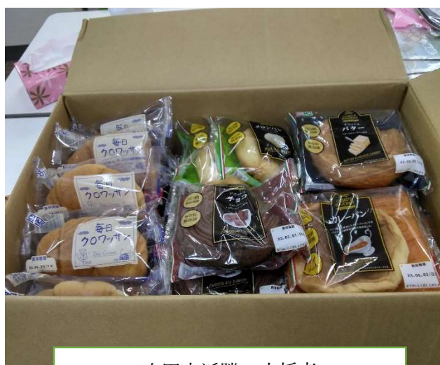
吹田市近隣の支援者

頂戴した寄付金は子ども食堂の材料やお菓子、備品などの購入に充てさせて頂いております。また、近隣の支援者の方などから数多くの寄付品もいただいております。一部を下記の写真でご紹介いたします。