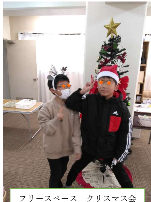
フリースペース クリスマス会