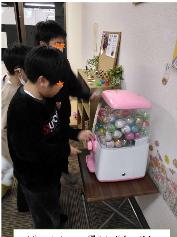
フリースペース 帰りにガチャガチャ

今年もたくさんの支援者の方から本やぬいぐるみ、パンやお米など食材の寄付だけでなく高額な寄付金を頂けることもございました。新しい取り組みとしてクリスマスやハロウィンのイベントのほかに 3D パズルなどのワークショップも 2 回開催することができ、ボランティアさんも子どもたちとのふれあいを楽しみにして、毎回参加していただいています。お母さん方も「幼稚園や小学校の保護者会のことなど、ゆっくり話ができて助かります。」とおっしゃってくれました。